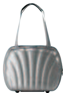
33829 (V22-001): BEAUTY CASE: BEAUTY CASE 37 X 29 X 19 - 13,00 L 🌿 🚰 📏