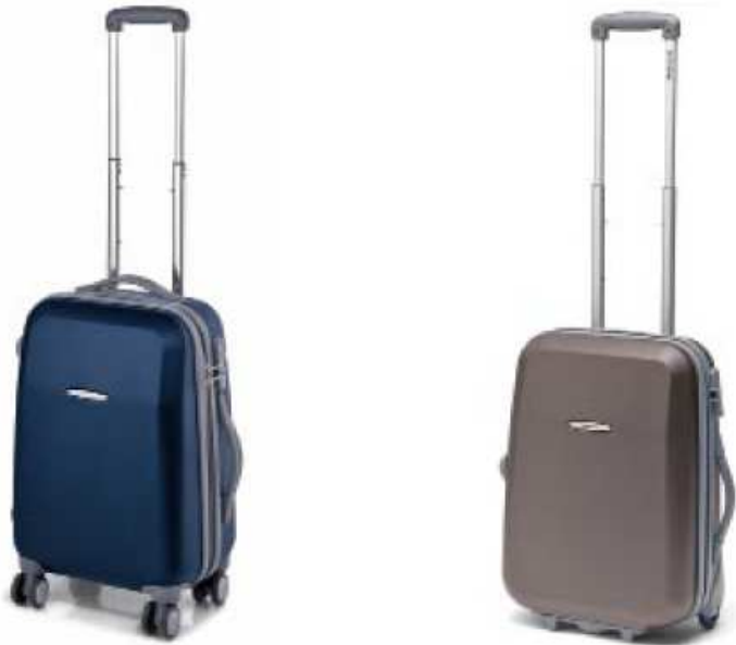
409703 | trolley cabina 4 ruote | cabin upright 4 wheels 409725 | trolley cabina 20 cm | cabin upright 20 cm

De ULTRA LIGHT omwille van zijn POLYPROPYLEEN-schaal, met 4-punts sluiting, en standaard TSA-slot. Verkrijgbaar in 5 basiskleuren, en 4 zomerse SPOT-colors. Voor de prijs hoeft u het niet te laten : € 149 voor de 70L, en € 159 voor de 90L. Volgende maand wordt ook nog de 4-wiel handbagage in het assortiment opgenomen. Bovendien heeft deze reeks in Duitsland het TÜV-kwaliteitslabel toegewezen gekregen. De koffers hebben alle testen met glans doorstaan.