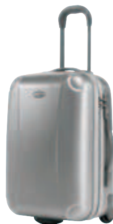
33839 (V04+002): UPRIGHT 55/20 ZIP: UPRIGHT 40 X 55 X 24 - 31,00 L