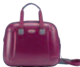
33843 (V04+001): BEAUTY CASE: BEAUTY CASE 35,5 X 28,5 X 16,5 - 10,00 L

Sky Wheeler 2 fut pensée pour allier légèreté et protection. Cette collection d'une grande résistance se décline dans un style moderne et léger. Elle existe dans une version avec fermeture à glissière ou avec cadre. Equipée d'une poignée ergonomique et d'une pochette zippée pour une organisation plus aisée, sa texture raffinée résiste aux rayures.